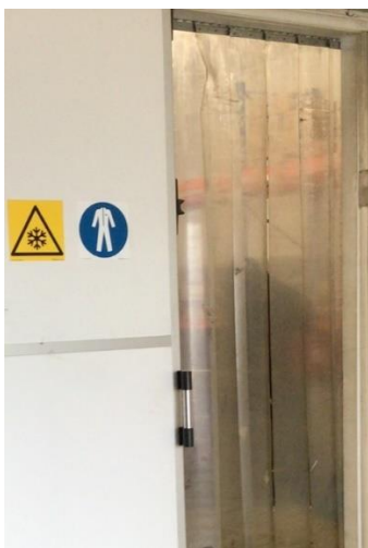
Foto 2. Ohumärgistused töökeskkonnas. Kollane märk hoiatab töötajat ruumi sisenemisel madala temperatuuri eest ning sinine märk kohustab töötajat kandma kaitseriietust.

Töandja on kohustatud märgistama asjakohaste ohutusmärkidega need töökoha ohualad, kus tuleb kasutada isikukaitsevahendit. Kohustusmärk paigaldatakse ohuala sissepääsu juurde, ohuallikale eriomase ohu korral paigaldatakse märk ohuallika juurde. Näiteks, on vajalik isikukaitsevahendi kandmise kohustusmärk paigaldada iga seadme juurde, millega töötamisel on töötajal isikukaitsevahendi kasutamine kohustuslik. Kui aga ohuala algab juba ruumi sisenemisel (nt tootmisruumis esineb pidev müratase töötavate seadmete tõttu, mis nõuab kuulmiskaitsevahendite kasutamist), on vajalik isikukaitsevahendite kandmise kohustusmärk paigaldada juba ruumi sissepääsu juurde. Üle poolte (53%) kontrollitud töökeskkondadest puudusid vajalikud isikukaitsevahendite kandmise kohustusmärgid.