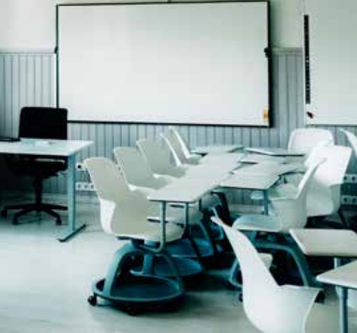
mis asub vana koolihoone kõige tagumises