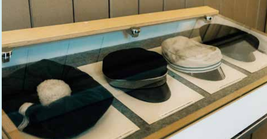
Möödnud aegade õpilaste kaunid peaktted on eksponeeritud kooli muuseumi-nurgas.