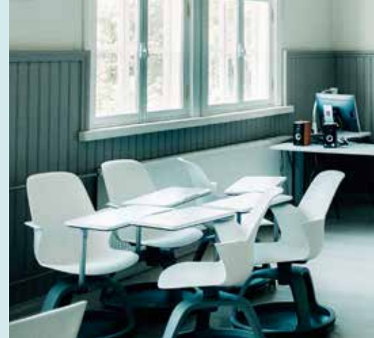
Hellitusnimega Kamtšatka kutsutakse klassi, nurgas.