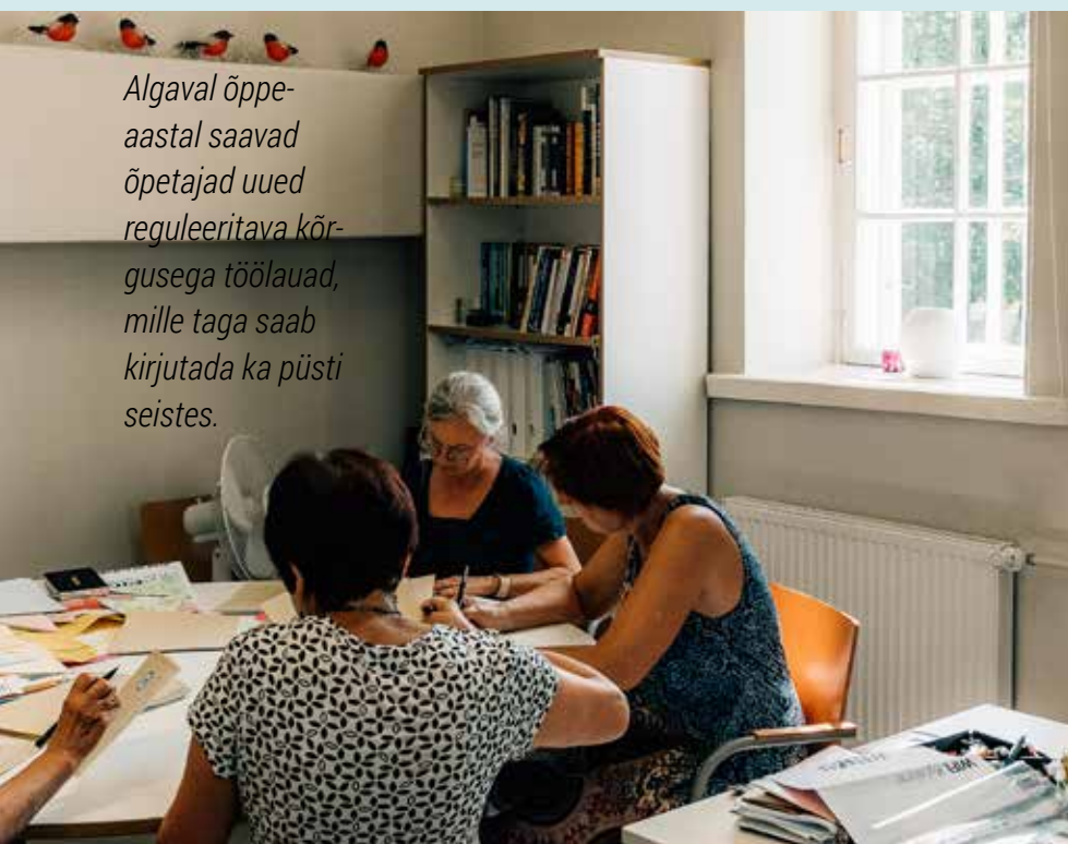
Algaval õppe-aastal saavad õpetajad uued reguleeritava kõrgusega töölauad, mille taga saab kirjutada ka püsti seisestes.

mendikaamera ja helisüsteem. Mõnes klassis on olemas ka vanamoodsad kriidiga tahvlid. „Matemaatikaõpetajad arvasid alguses, et vanad tahvlid peaksid jääma, sest neil on vaja pikki tehteid tahvlile kirjutada. Kui nad avastasid, et digitahvlile mahub veelgi rohkem tehteid, siis vanade tahvlite kasutamisest loobuti ning need on meil seinal pigem mälestusesemeks,“ muigab Nobel.