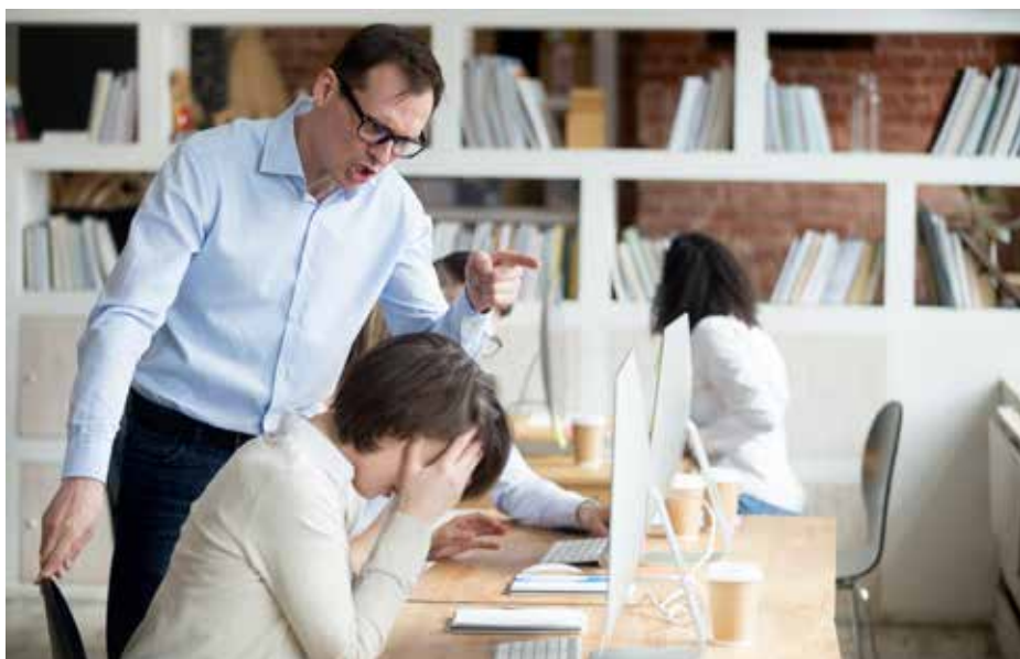
Töökiusamisena tõlgendatakse erinevaid olukordi.

Ei saa kindlalt väita, et eelnimetatud olukorrad ei ole kiusamised, kuivõrd pole teada kogu sündmuste ajalugu, millise hääletooni ja tagamõttega midagi öeldi, mis olid vastaspoole põhjendused jne. Ka Ringkonnakohus on oma 28. veebruari 2018. aasta otsuses 2-16-18320 tõdenud, et kiusamist on keeruline defineerida, selgitades järgmist: „Maakohus on põhjendatult leidnud, et töökius seisneb praegusel juhul kostjate poolt kogetus, mistõttu ei ole tegemist asjaoluga, mille esinemist või mitteesinemist oleks kohtul võimalik objektiivselt kontrollida.“