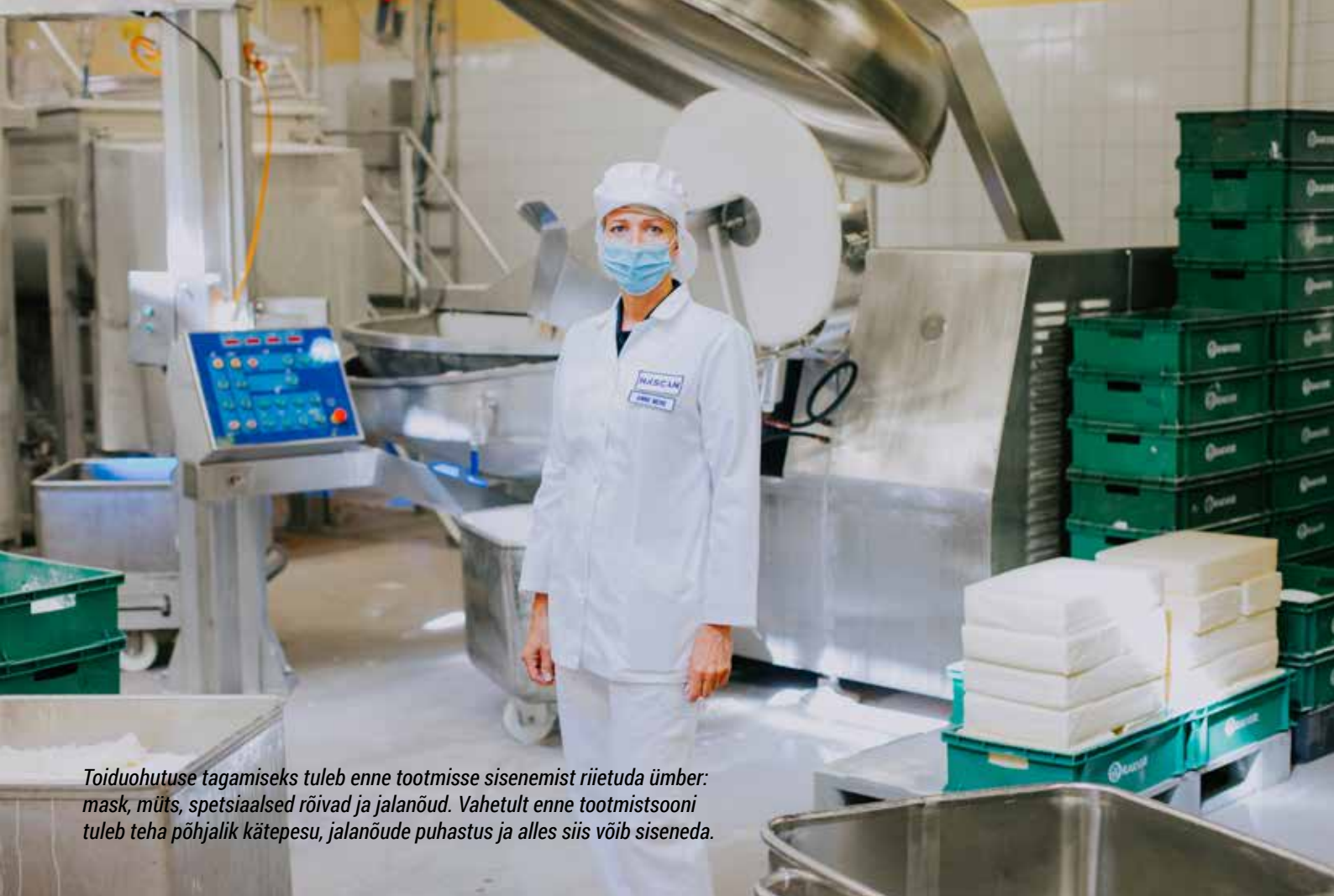
Toiduohutuse tagamiseks tuleb enne tootmisse sisenemist riietuda ümber: mask, müts, spetsiaalsed rõivad ja jalanõud. Vahetult enne tootmistsooni tuleb teha põhjalik kätepesu, jalanõude puhastus ja alles siis võib siseneda.

Eestis isegi rohkem impordile avatud ja selle võrra on Eestis konkurents tihedam.