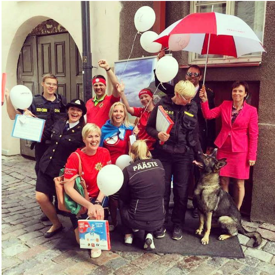
Päästeameti lõbusad töötajad.