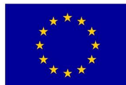
Euroopa Liit Euroopa Sotsiaalfond

Tänaseks on töökeskkonna juhtimise koolituse (nimetuse AS Tallink Grupis 24- tunnisele volinike ja nõukogu liikmete väljaõppele) läbinud umbes 300 AS Tallink Grupi töötajat. Oluliselt on märgata, et paranenud on üldine ohutuskultuur. Töökeskkond on igapäevane teema kõikidel juhtimistasanditel. Uute tegevuste planeerimisel alati arvestatakse töökeskkonna ohtudega. Töökonna sisekontrollide tulemused on kahe aasta jooksul pärast koolitusi paranenud, puudusi tuvastatakse järjest vähem. Registreeritud kergeste tööõnnetuste arv on tõusnud mitmekordselt. See näitab inimeste teadlikkust, et ka väiksematest vigastustest on vaja teatada ning nad teavad, et õnnetustest teatamine aitab edaspidiselt suuremaid vigastusi ennetada. Samuti on hakatud teatama ohtlikest olukordadest, sest teatakse, mida selline olukord tähendab ja, mida võib kaasa tuua kui sellega ei tegele. Osatakse tähelepanu ohutute töövõtete kasutamist töökohal, märgatakse üksteist. Töökeskkonna juhtimise tulemusena on töötervishoiu ja tööohutuse korraldus arvestatud igapäevaselt kõikidel tegevustel kõikidel ettevõtte juhtimise tasanditel.