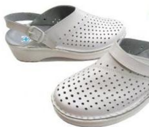
Turvajalanõud on mugavad ja lasevad jalgadel ka „hingata“.