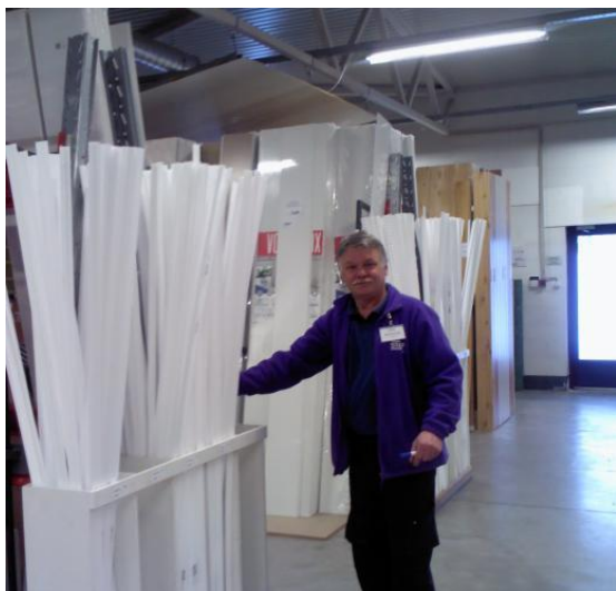
Töötajad on muudatustega rahul.

Ettevõtte sai poe klientidelt palju head tagasisidet ning saalitöötajad on samuti uuendustega rahul. Uusi pluuse kantakse hea meelega ning need on eelmistest kergemad ja ilusamat värvi. Tänu uutele jalanõudele ei valuta enam ei selg ega jalad, töövõime on kasvanud ning tehtud uuendused on toonud siira naeratuse müüjate näole.